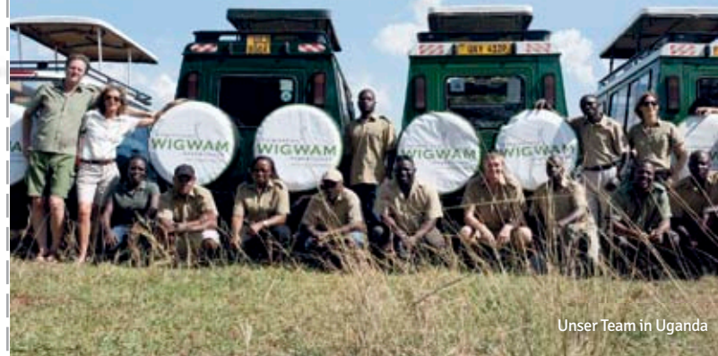
Unser Team in Uganda

WIGWAM Naturreisen & Expeditionen +49 (0)8379 - 920 60 CH +41(0)71 - 244 45 01 info@wigwam-tours.de www.wigwam-tours.de