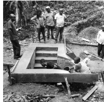
Hilfe für Gemeinden im Umfeld des Maiko-Parks: oben Ausbau einer Trinkwasserquelle, unten eine Ölmühle, in der Palmöl gepresst wird.

Der Vorstand der Berggorilla & Regenwald Direkthilfe