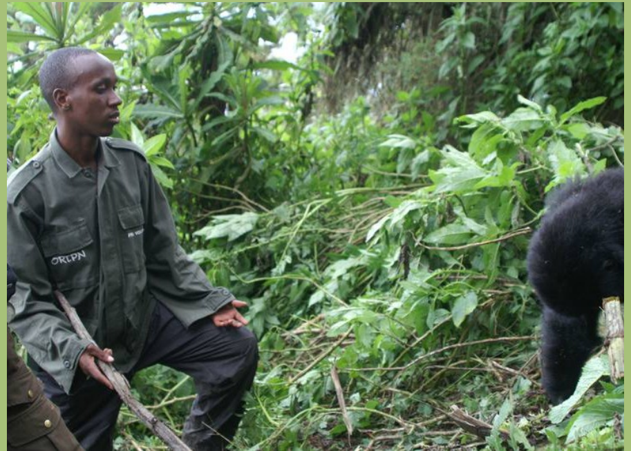
Wildhüter mit einem Gorilla im Vulkan-Nationalpark, Ruanda

Wir haben keine eigenen Projekte, sondern unterstützen die Schutzgebiete bzw. andere Naturschutzorganisationen, wenn dringend etwas benötigt wird. Wir arbeiten dabei mit Ansprechpartnern vor Ort zusammen, denen wir vertrauen.