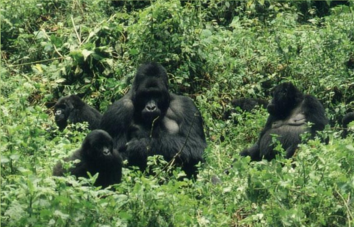
Nindja-Gruppe, Kahuzi-Biega

Gorillas leben ausschließlich in den tropischen Regenwäldern Afrikas.