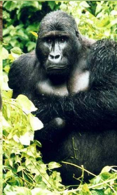
Silberrücken: Grauergorilla