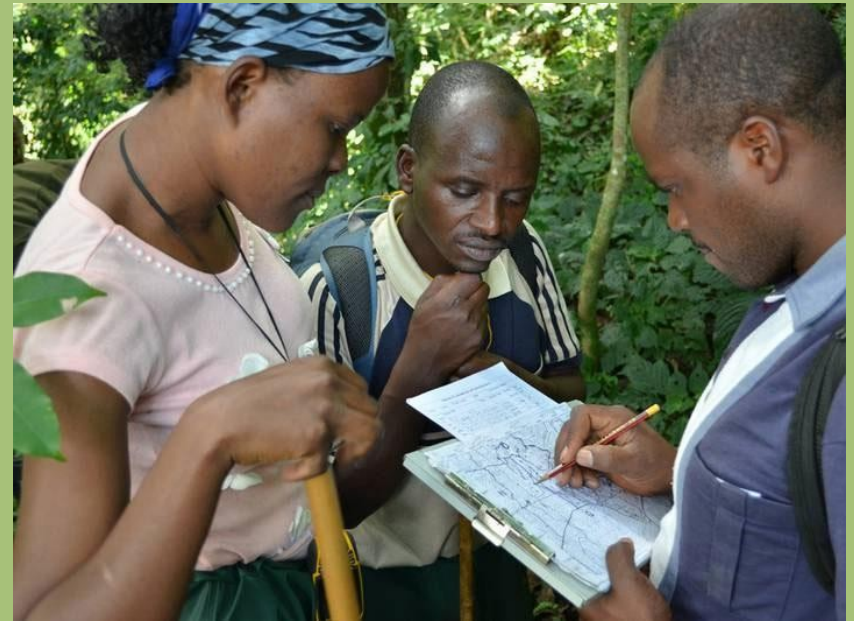
Das Team bei der Gorillazählung