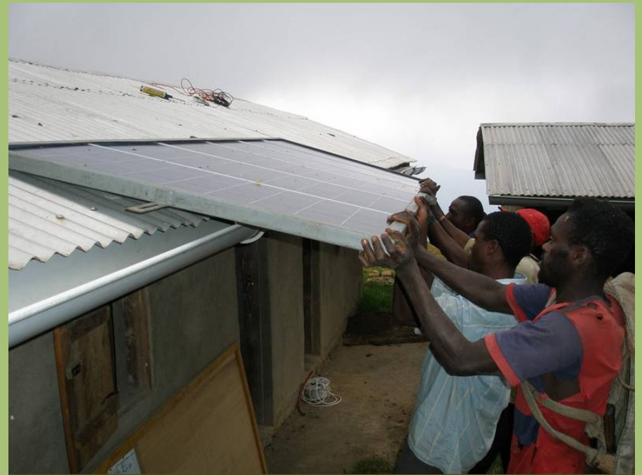
Montage der reparierten Solaranlage in Kagwene

Wir verfolgen in unserer Arbeit kein starres Konzept, sondern entscheiden individuell, schnell und unbürokratisch.