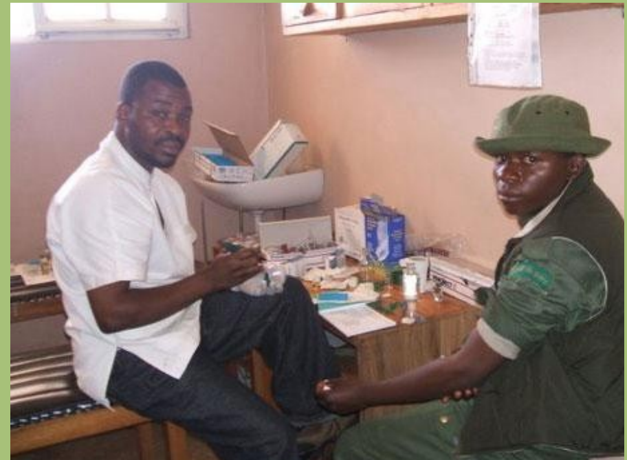
Ein Wildhüter wird im Rahmen des Gesundheitsprogramms für Park-Mitarbeiter untersucht.