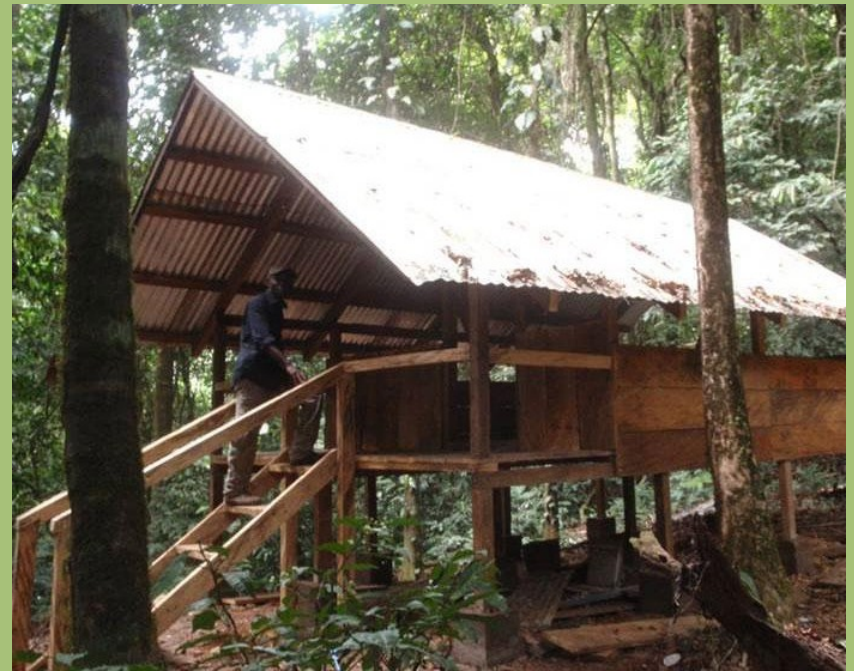
Das neue Basis-Camp in Afi