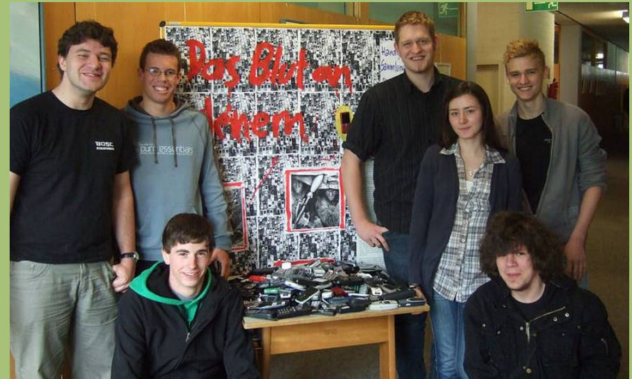
Schüler der Albert-Schäffle-Schule mit dem Ergebnis ihrer Handy-Sammelaktion