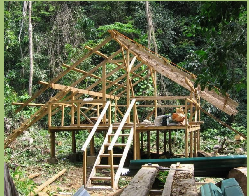
Das neue Camp in Mbe im Bau