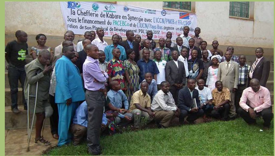
Organisation eines Treffens mit politisch-militärischen und traditionellen Machthabern