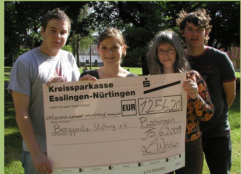
Schüler des Gymnasiums Plochingen spenden die Einnahmen einer Schulparty mit einem symbolischen Scheck.)