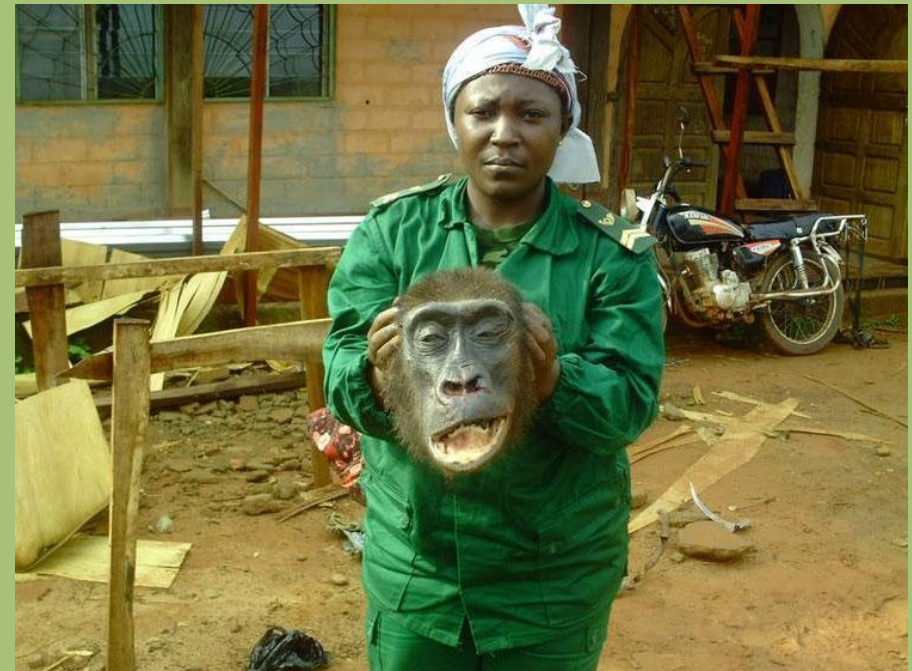
Bei einer Aktion in Ostkamerun gefundener Gorillakopf

In weiten Teilen ihres Verbreitungsgebiets werden Gorillas wegen ihres Fleisches gejagt, obwohl dies überall gesetzlich verboten ist.