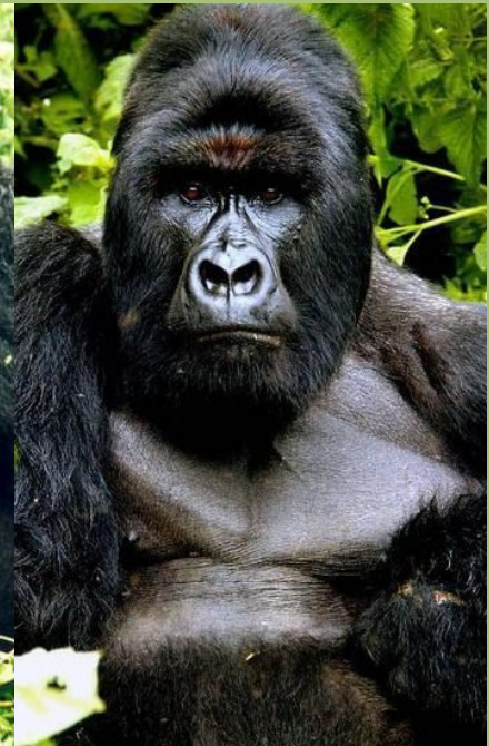
Silberrücken: Berggorilla, (© Paul Taggart)