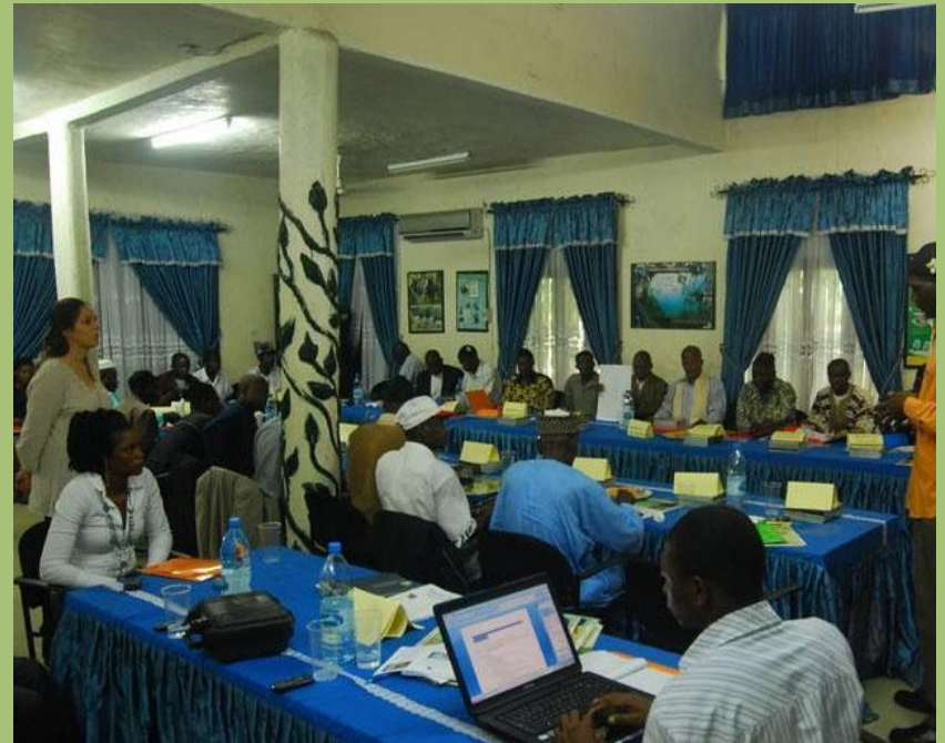
Informationsveranstaltung für lokale Chefs