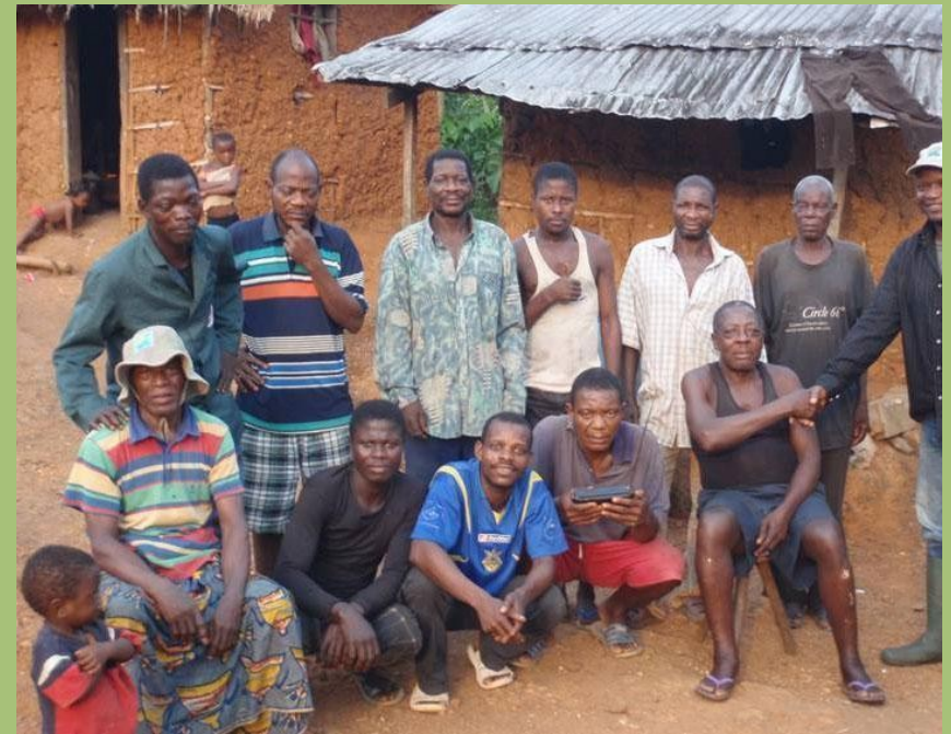
Der Chef von Takpe empfängt die WCS-Mitarbeiter.