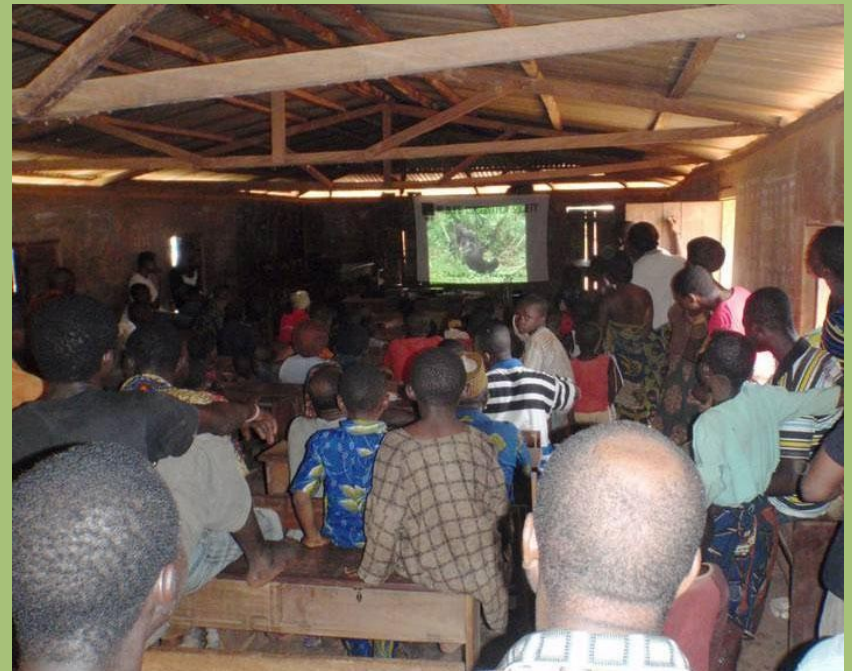
Vorführung eines BBC-Films über Gorillas. Der Beamer wird übrigens mit Muskelkraft betrieben!