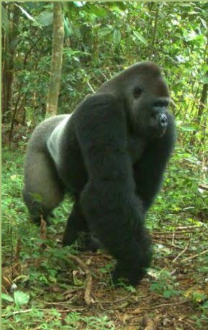
Silberrücken: Cross-River-Gorilla