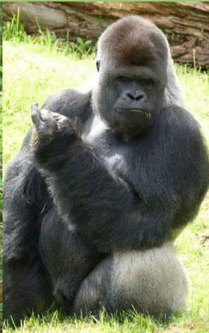
Silberrücken: Westlicher Flachlandgorilla (© Angela Meder)