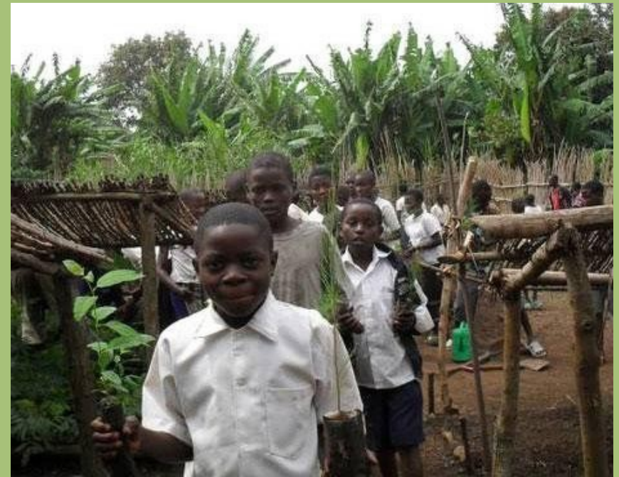
Schüler in der Baumschule