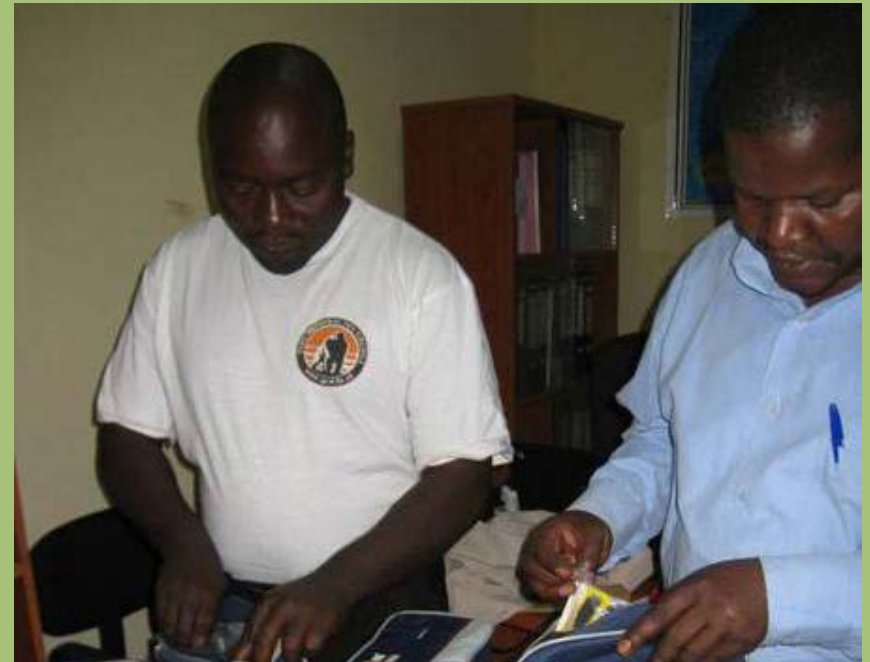
Kompass und GPS-Geräte