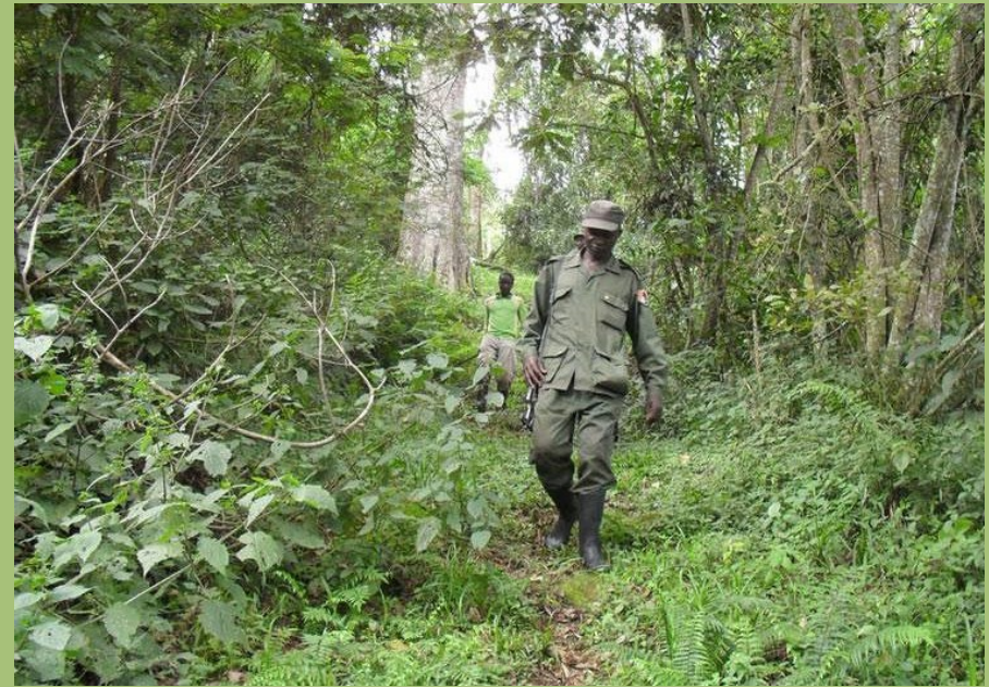
Patrouille entlang der Grenze des Sarambwe-Reservats