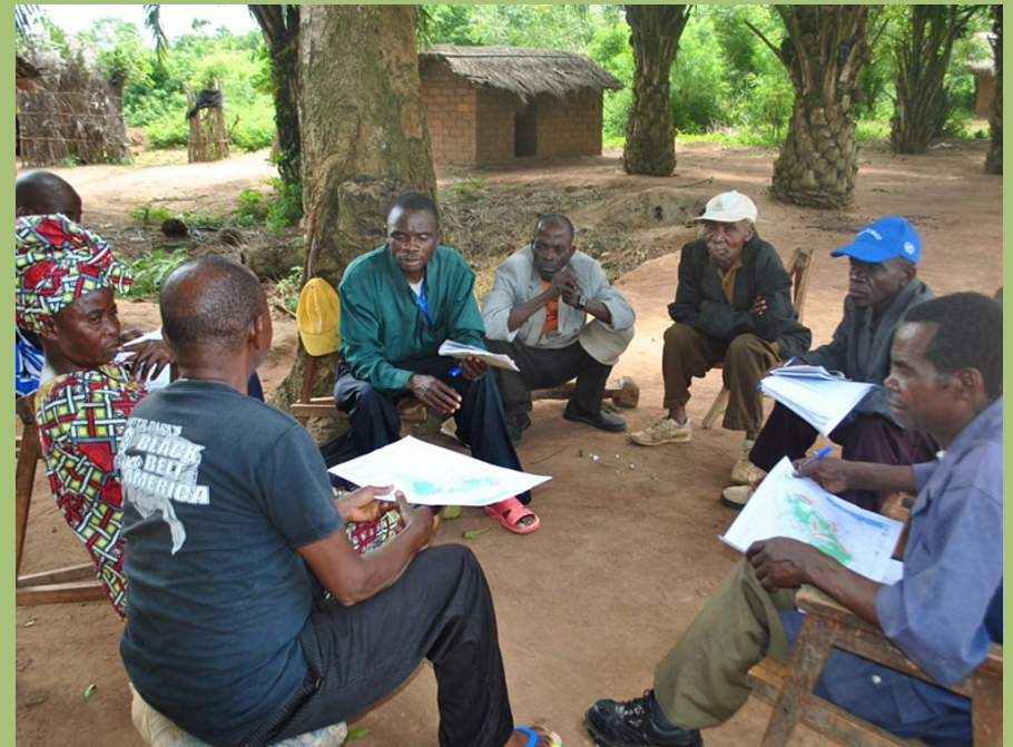
Besprechung zur Grenzziehung