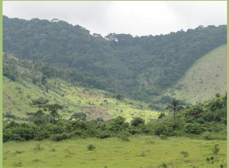
Mayombe: der Wald hinten liegt in Cabinda, Angola; vorn Niari, Republik Kongo

Wenn die menschliche Bevölkerung wächst, braucht sie immer mehr Platz, um Felder anzulegen. Vor allem in dicht besiedelten Regionen geht so viel Wald verloren. Aber auch durch wirtschaftliche Ausbeutung der Ressourcen wird Wald vernichtet.